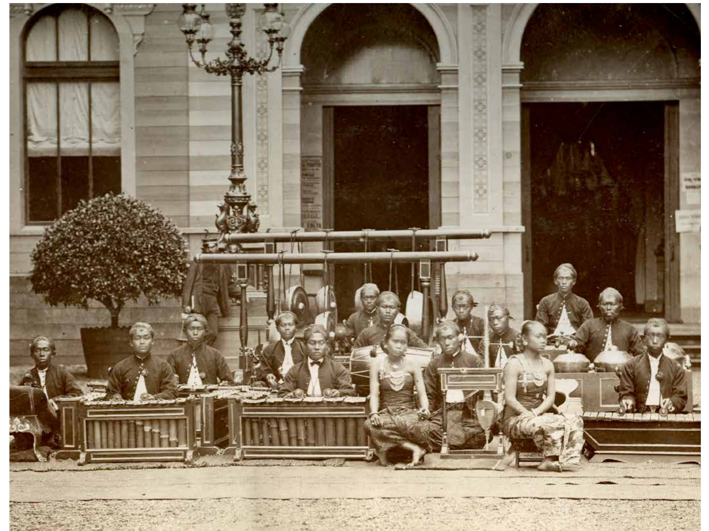
Het gamelangezelschap dat in 1879 bij de koloniale tentoonstelling in Arnhem optreedt.

Datum en tijd: zondag 8 oktober van 13.00 tot 15.00 uur