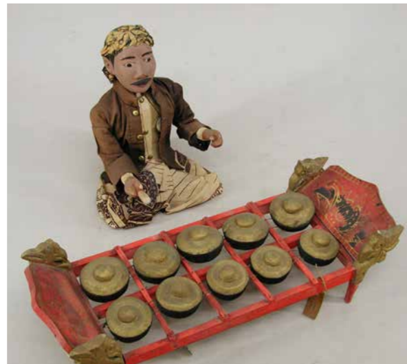
Miniatuur gamelanspeler (collectie Museum Bronbeek).

In 1879 komt een Indonesisch gezelschap van dertien muzikanten en twee danseressen naar Arnhem om op te treden. Vlakbij in schouwburg Musis Sacrum wordt een koloniale tentoonstelling gehouden. In samenwerking met het ministerie van Koloniën, Bronbeek, Arnhemse bedrijven en de oud-resident van Surakarta, F.N. Nieuwenhuijzen, wordt een gamelangezelschap naar Arnhem gehaald. Het gezelschap wordt begeleid door de zoon van sultan Mangkoenegoro IV van Solo, op Midden-Java. Programma in samenwerking met Rozet Arnhem.