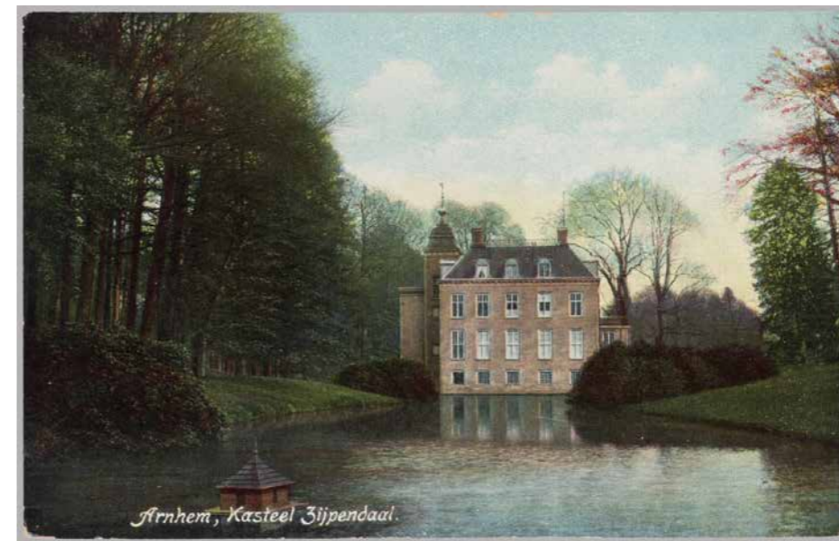
Beeld van kasteel Zypendaal, dat ook een koloniale geschiedenis kent.