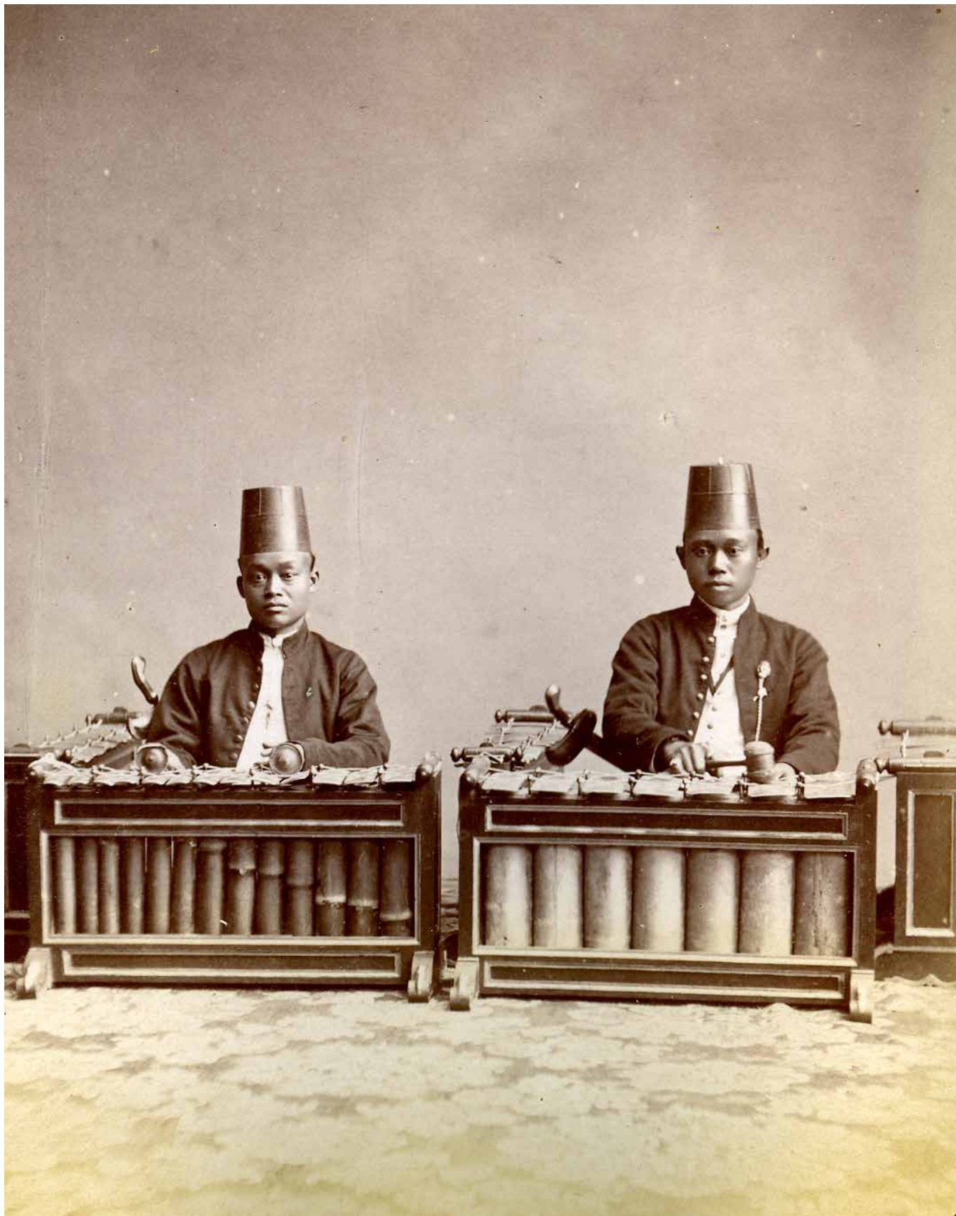
Twee gamelanmuzikanten van het gezelschap dat in 1879 in Arnhem optrad.